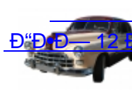
Ѓ“Ѓ•Ѓ— 12 Ѓ—Ѓœ