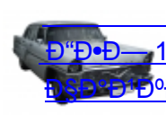
Ѓ“Ѓ•Ѓ— 13, 14 Ѓ•Ѓ•Ѓ•Ѓ•Ѓ•