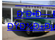
Ѓ“Ѓ•Ѓ— Ѓœ20 Ѓ•Ѓ•Ѓ•Ѓ•Ѓ•Ѓ•