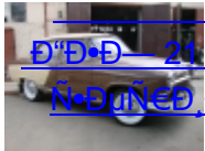
Ѓ“Ѓ•Ѓ— 21 (1, 2, 3 Ѓ•Ѓ•Ѓ•Ѓ•Ѓ•Ѓ•)